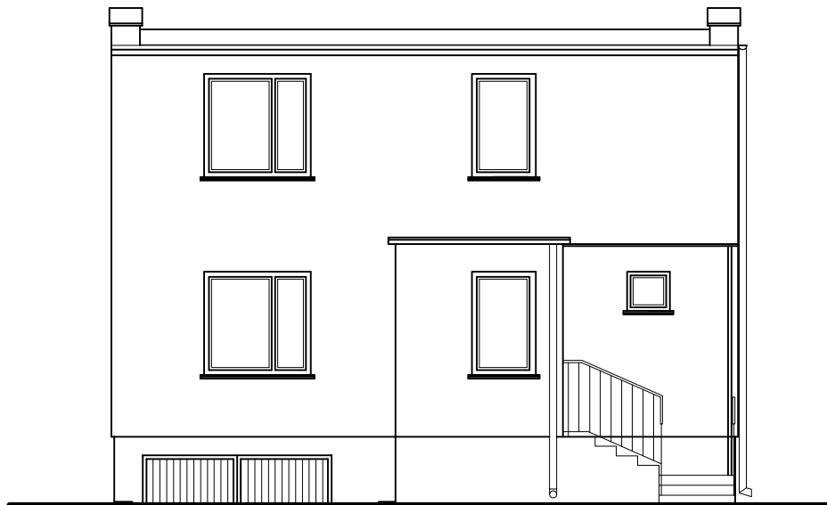
ELEWACJA WSCHODNIA SKALA 1:100